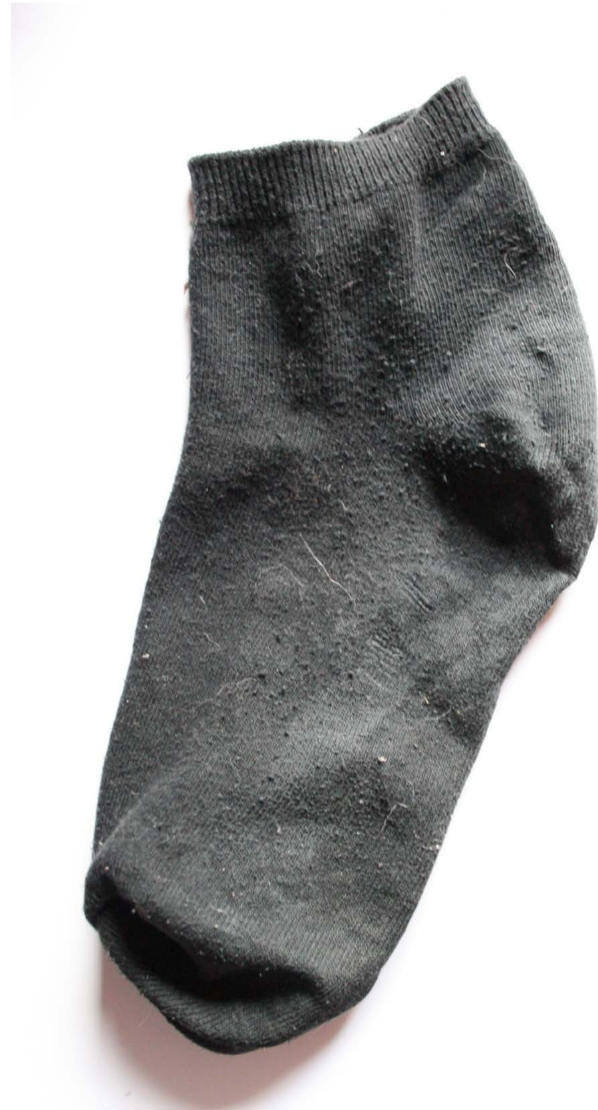
Calzino solo (non-spaiato)